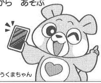
けんこうまちゃん