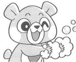
けんこうまちゃん